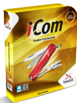
Gestion Commerciale Avancée