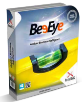
Analyse, Business Intelligence