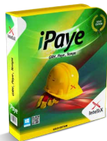
Ressources Humaines et paye