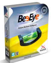
Analyse, Business Intelligence